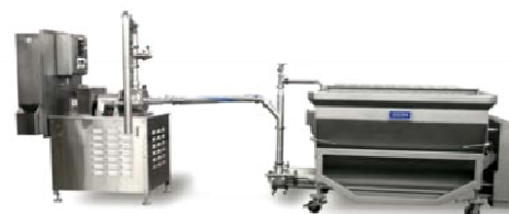
Система AR901MC со шнековым загрузчиком