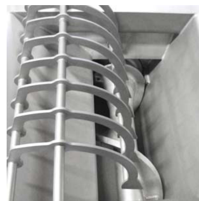
Шнек и направляющий блок для замороженного сырья